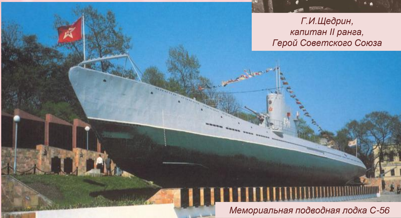
Мемориальная подводная лодка С-56