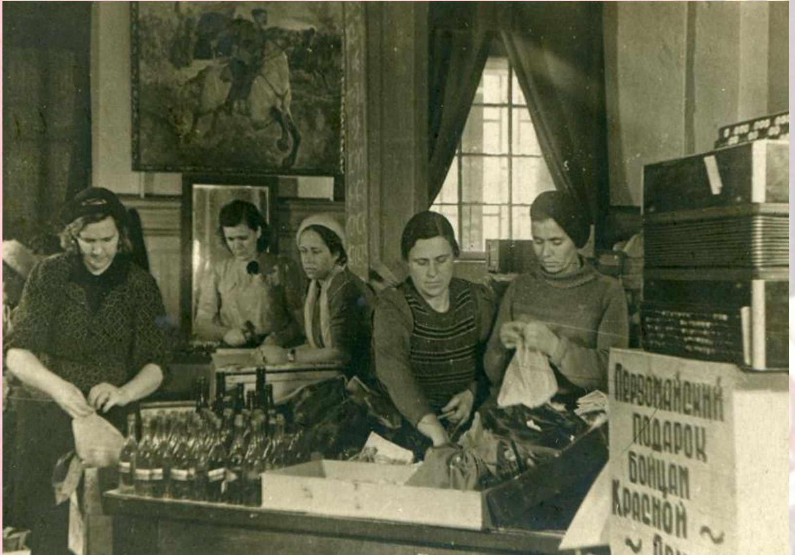
Сбор подарков на фронт