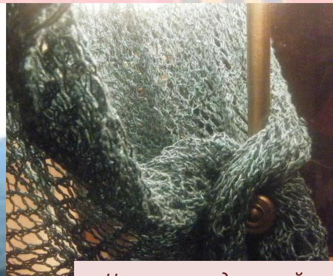
Нитки из водорослей