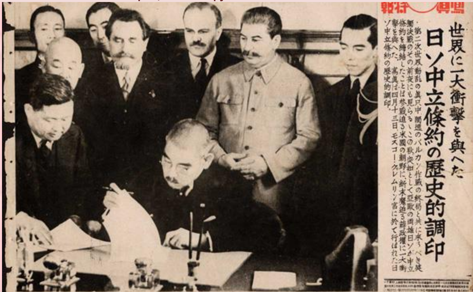
Подписание пакта о нейтралитете с Японией в 1941 г.

Утром 22 июня 1941 г. началась Великая Отечественная война. Приморье не было ареной боевых действий, но жизнь края определялась его пограничным положением. В 125 км. от Владивостока и в 95 км. от Уссурийска вдоль советско-китайской границы находились японские войска. Еще в апреле 1941 г. СССР заключил с Японией Пакт о нейтралитете, однако Япония продолжала наращивать вооруженные силы на континенте