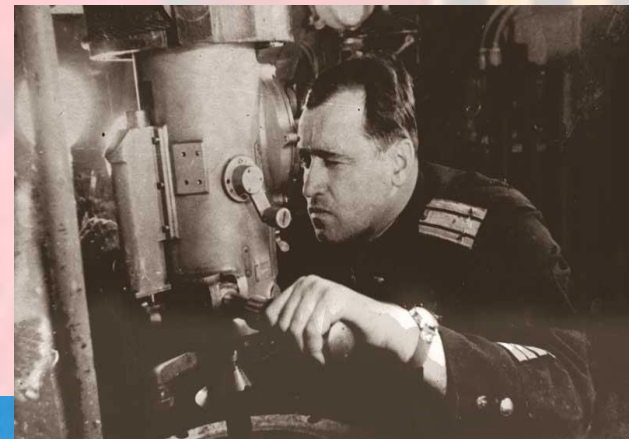
Г.И.Щедрин, капитан II ранга, Герой Советского Союза

Корабли и подводные лодки Тихоокеанского флота воевали на Северном и Черноморском флотах.