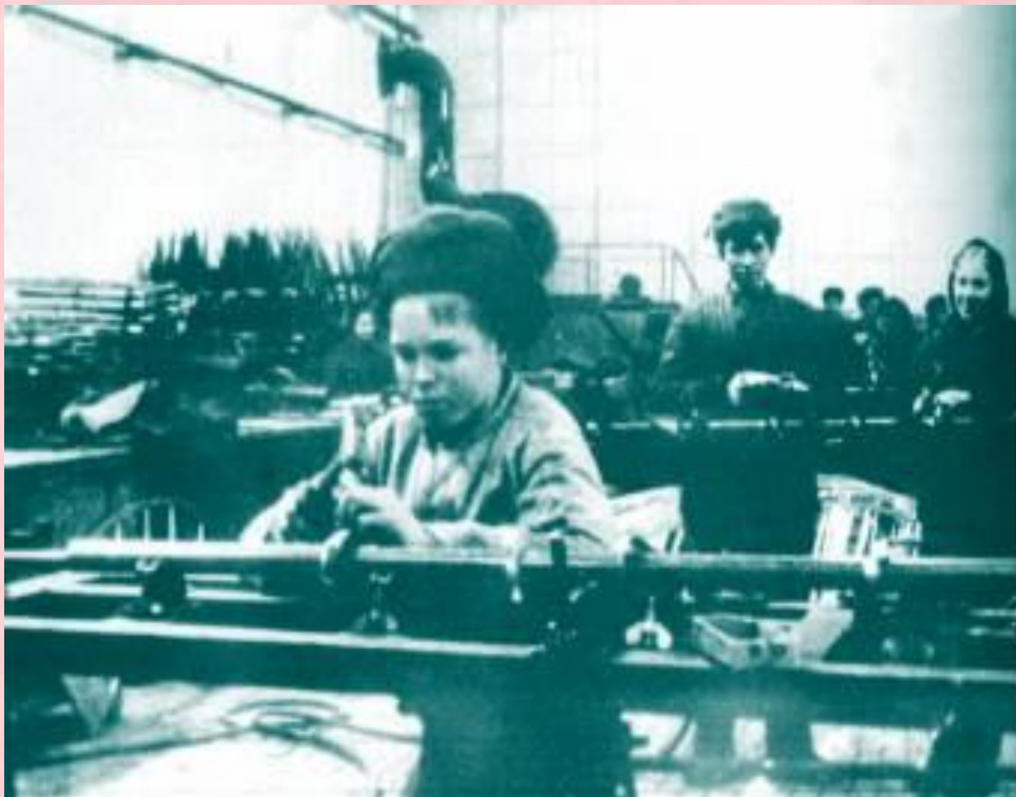
Авиационный завод в Арсеньеве. Подростки заменили отцов, ушедших на фронт