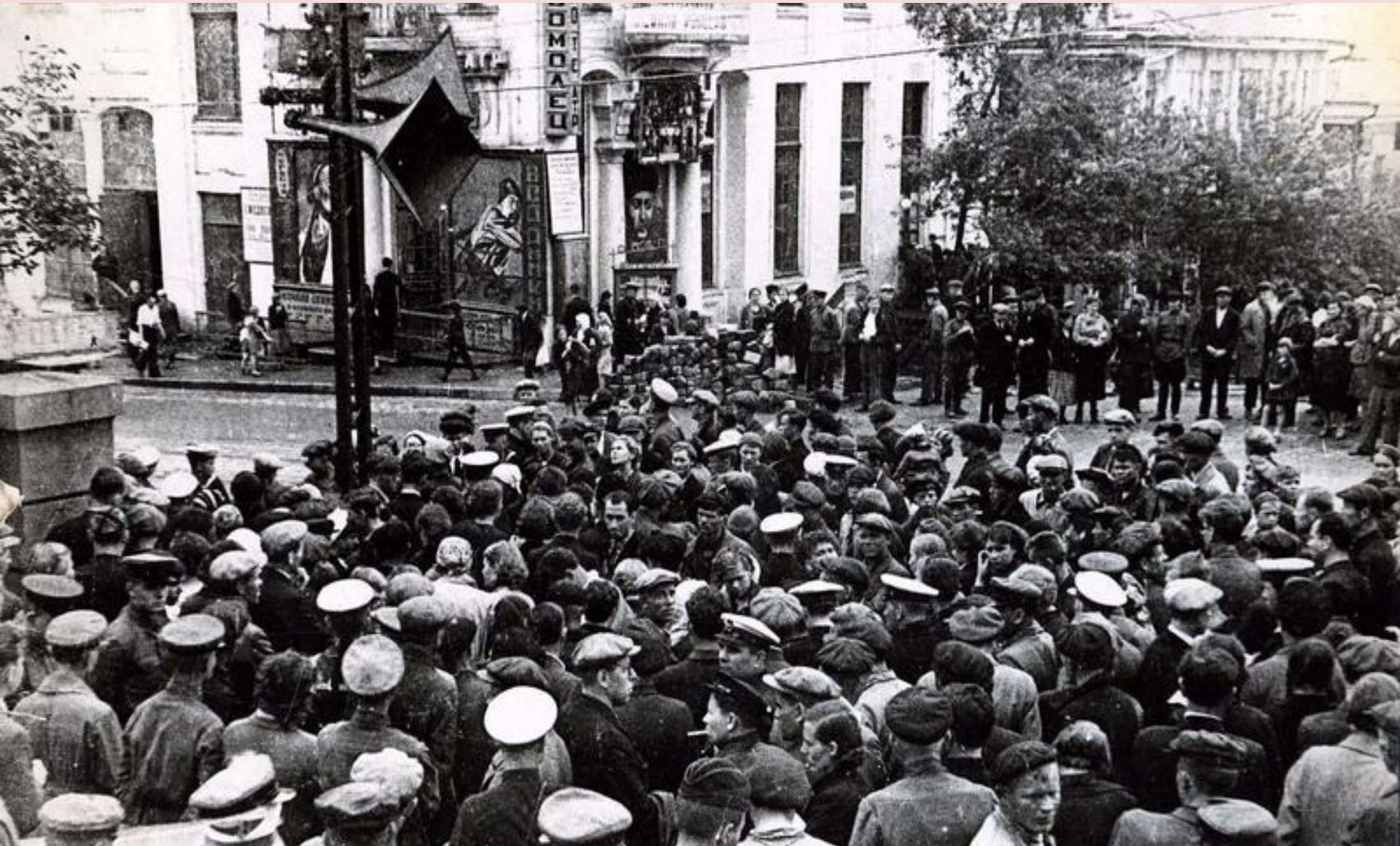
Первые дни войны. Владивостокцы слушают военную сводку из Москвы

Известие о нападении фашистской Германии пришло в край вечером 22 июня 1941 г.