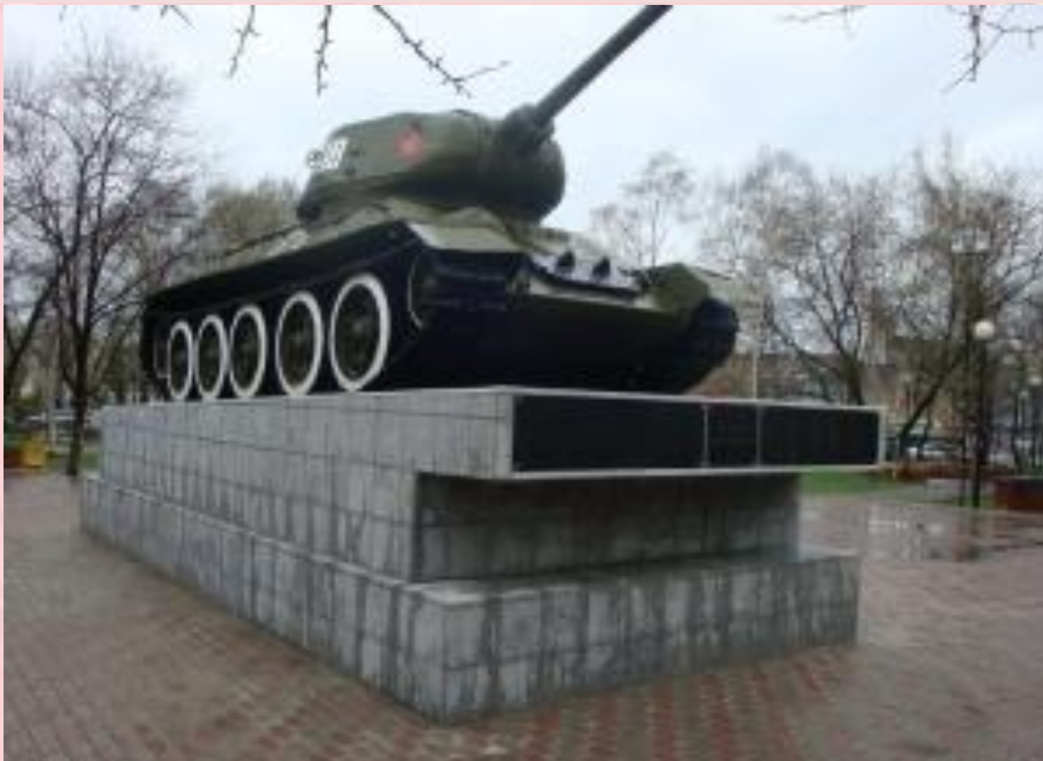
Памятник в честь танковой колонны «Приморский комсомолец»

Тысячи приморцев ушли на фронт добровольцами. Ими были укомплектованы экипажи, построенной на средства жителей края танковой колонны «Приморский комсомолец»