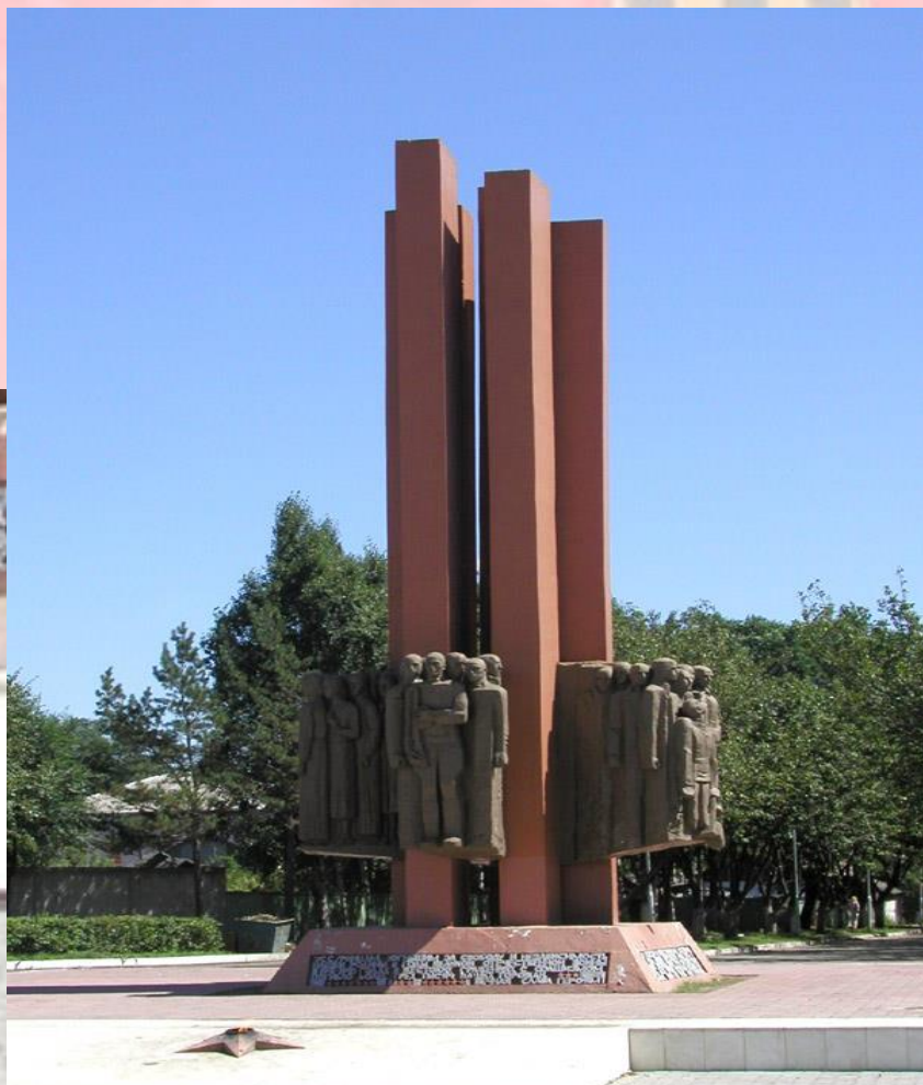
Памятник погибшим в годы Великой Отечественной войны в городе Уссурийск