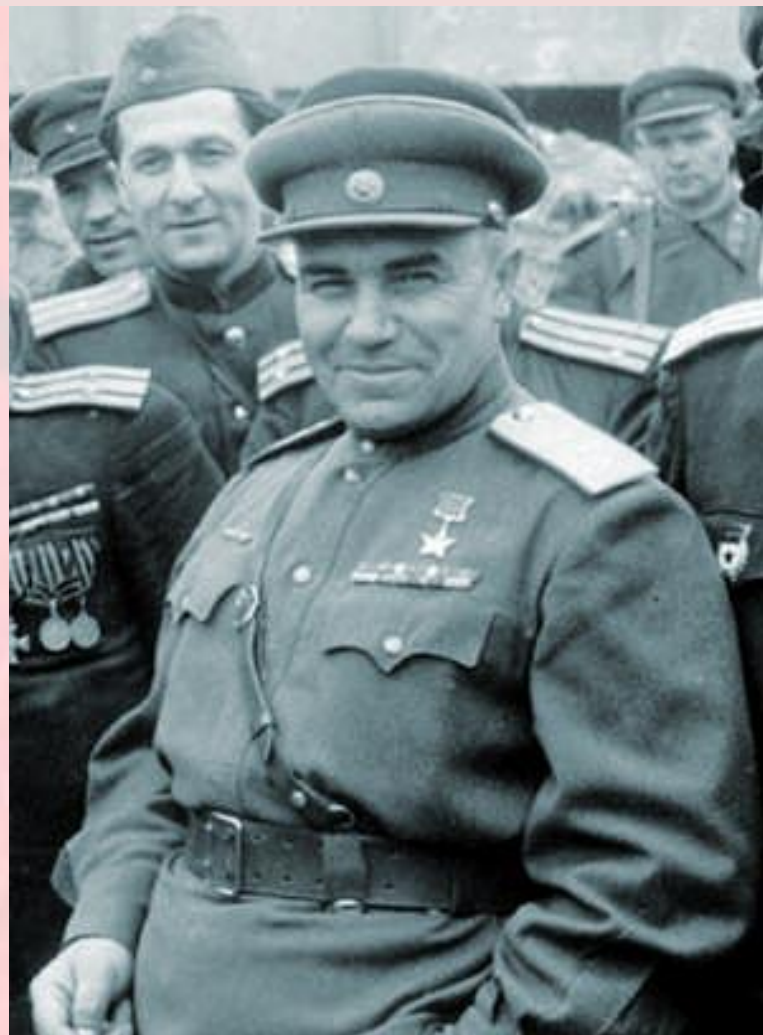
Николай Эрастович Берзарин