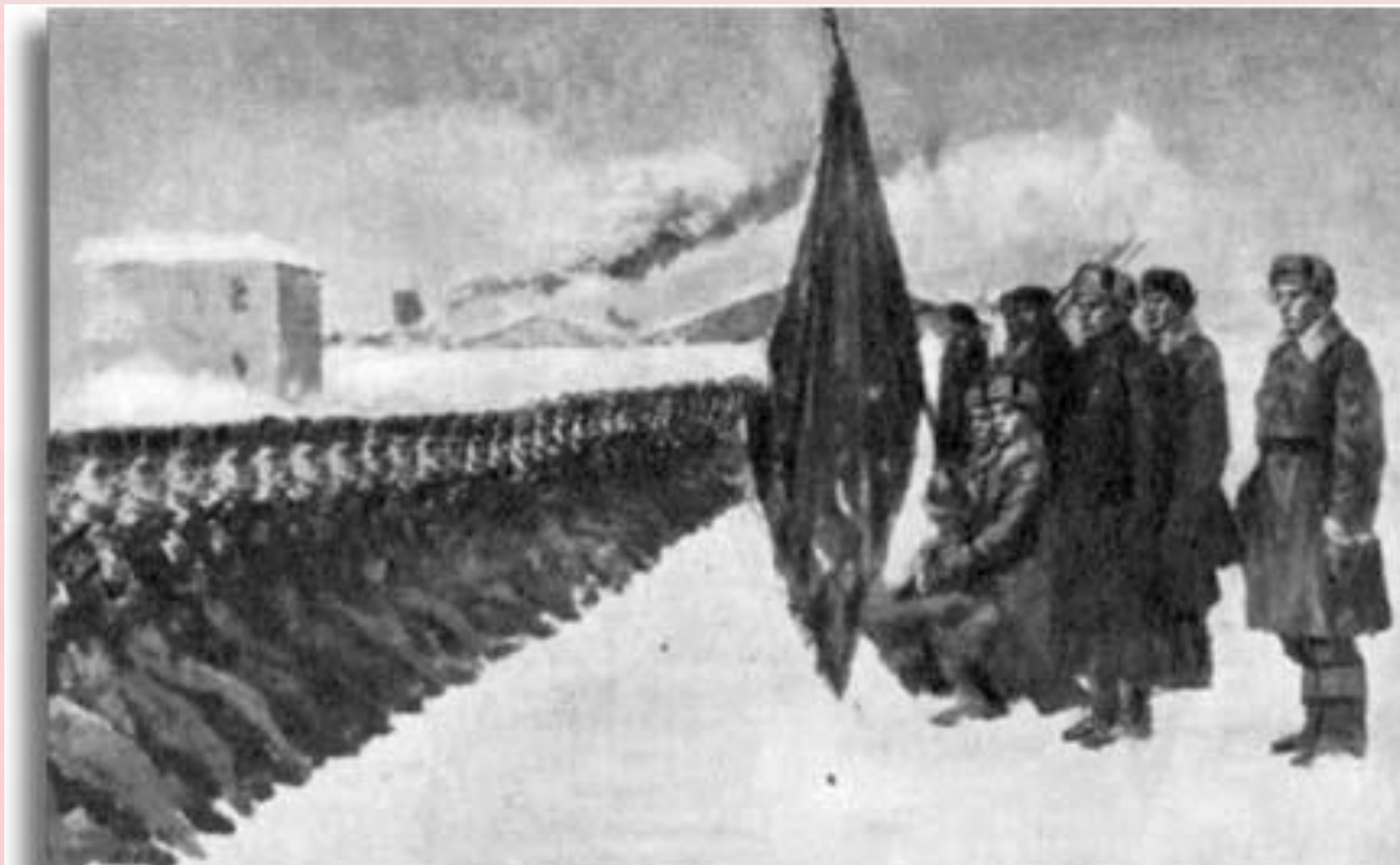
Воины-тихоокеанцы в битве под Москвой